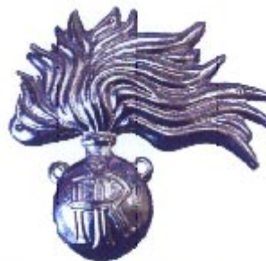
Conventional Arms no. 2B (solid) Emblème Conventionnel no. 2B (plein)

Ansøgningsnr.: AI 2006 00150 Ansøgt: 23. september 2006