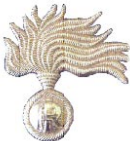
Conventional Arms no. 2A (solid) Emblème Conventionnel no. 2A (plein)

Ansøgningsnr.: AI 2006 00149 Ansøgt: 23. september 2006